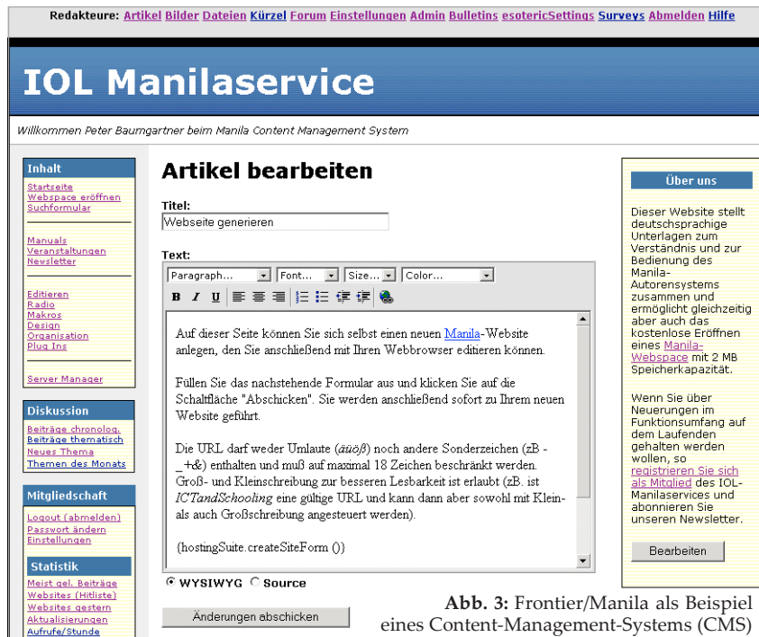
Abb. 3: Frontier/Manila als Beispiel eines Content-Management-Systems (CMS)

Hier beschränken sich die Online-Aktivitäten auf maximal 20% der Unterrichtszeit. Dieses Modell beruht auf einer relativ strikten Trennung zwischen (statischem, z.T. auch wie bisher in Papierform vorliegendem) Inhalt und einiger über das Internet durchgeführten Supportaktivitäten (Recherche, Verwendung von E-Mail bzw. Herun-